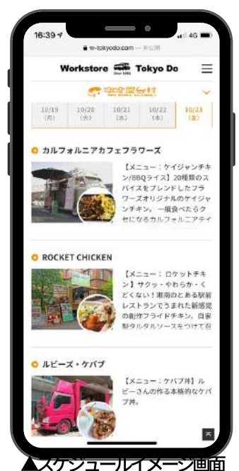
▲スケジュールイメージ画面