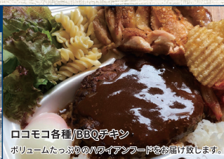
ロコモコ各種/BBQチキン ボリュームたっぷりのハワイアンフードをお届け致します。