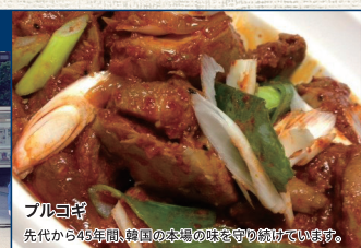
ブルコギ 先代から45年間、韓国の本場の味を守り続けています。

・交通状況などの影響で営業時間が遅れる場合がございます。 ・予告なしにお休みとなるネオ屋台もございます。 ・出店ネオ屋台、メニューは変更になる場合がございます。 ・みなさまの注文を受けてから目の前で調理いたします。 ・そのため通常のお弁当よりお客様にお出しできるまで長めに お時間をいただくことになります。