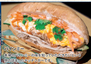
バインミー 本場のバインミーの味を知っていたいという 想の詰まったキッチンカーです。