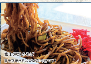
富士宮焼きそば 富士宮焼きそばは東京第1号店です!