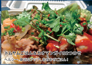
トムヤムごはん&かつマンがいの2つのせ ヘルシー、身軽なアジア、まぜまぜごはん!