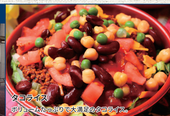
タコライス ボリュームたっぷりで大満足のタコライス。