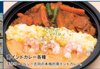
南インドカレー各種 手作りのヘルシー志向の本格的南インドカレー。