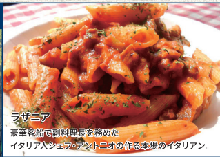
ラザニア 豪華客船で副料理長を務めた イタリア人シェフとパントミオの作る本場のイタリアン。