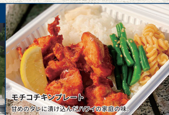
モチコチキンプレート 甘めのタレに漬け込んだハワイの家庭の味。